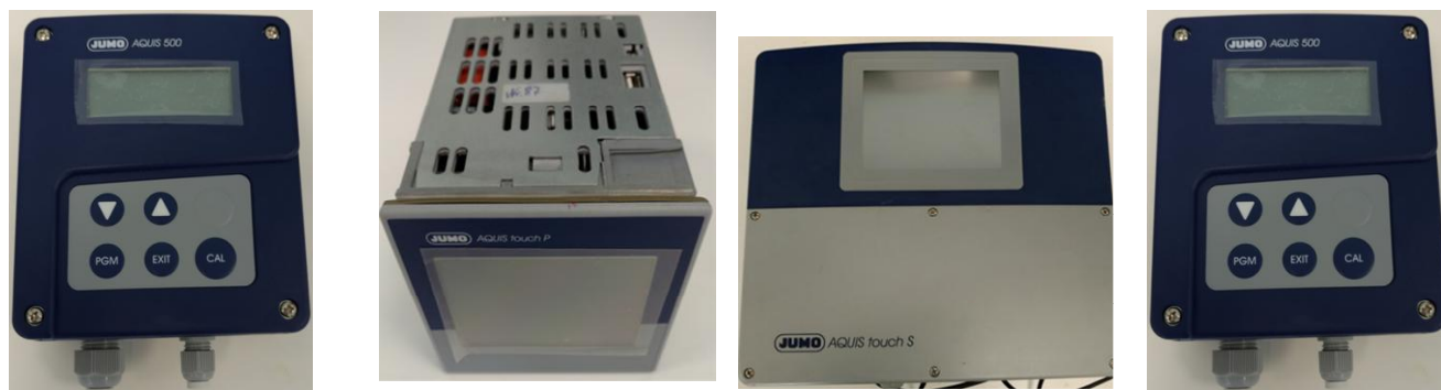
Анализатор жидкости промышленный серии AQUIS модификации AQUIS 500AS

Общий вид анализаторов жидкости промышленных серии AQUIS, модификаций AQUIS touch S, AQUIS touch P, AQUIS 500RS, AQUIS 500AS представлен на рисунке 1.